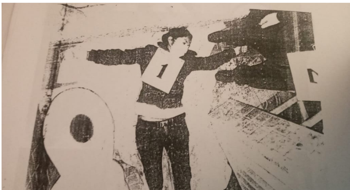
Reconstrucción de la escena del crimen.