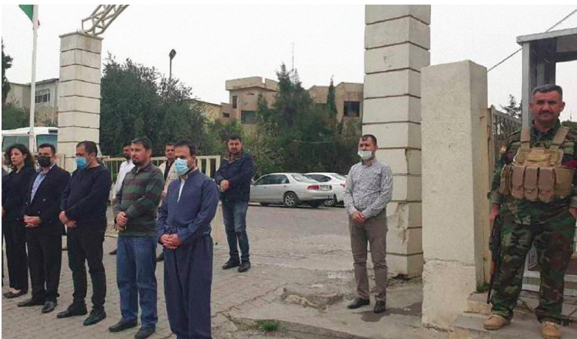
پاسه واتیکی چه کدار له ده روزه ی زانکۆی سه لحه دین ده بیتریت له ۲۰۱۰. سه رچاوه: نه خشه ی گوگل.

یه که م، له کاتی لیکۆلینهوه کاغان ئاماژه یه کی به هیزمان دۆزیه وه که شوینی رفاندنه که له لایهن پاسه وانی ئه منی چه کداره وه پارێزراوه و له لایهن کامیترای ئه منی (سی سی تی فی) هوه چاودیری کراوه. په نچ عه لانه دین - رۆژنامه نووسی گاردیان - تییینی کرد که رفینه ره کان کاتیک سه ده شتبان فری داوه ته ناو ئۆتۆمبیلێکه وه پووبه پرووی هیچ پێگره ک نه بوونه ته وه له لایهن پاسه وانه چه کداره کانی به رده م زانکۆکه. 166 ههروه ها دانا ئه سه ده، رۆژنامه نووس بۆ نیقاش قسه ی له گه ل چه ند شایه تحالیک کرد که پرووداوه که یان بینوه. یه کیک له شایه تحاله کان وتی: ”چوار چه کدار به ئۆتۆمبیلێکه وه هاتن بۆ زانکۆ و سه ده شتبان گرت و بردیان“. شایه تحاله که دواتر ئه وه شی وت که پاسه وانه ئه منیه کانی به شی ئینگلیزی و هونه ره جوانه کان له وێ بوون به لām هیچان نه کرد. 167 له راگه یه ندرای لیکۆلینهوه فه رمیه که دا هیچ ئاماژه یه ک به وه نه کراوه که پاسه وانه کان یان ئه و شایه تحاله نه ی که له شوینی پرووداوه که بوون چاوپیکه وتنیان له گه ل کرابیت بۆ لیکۆلینهوه فه رمیه کان.