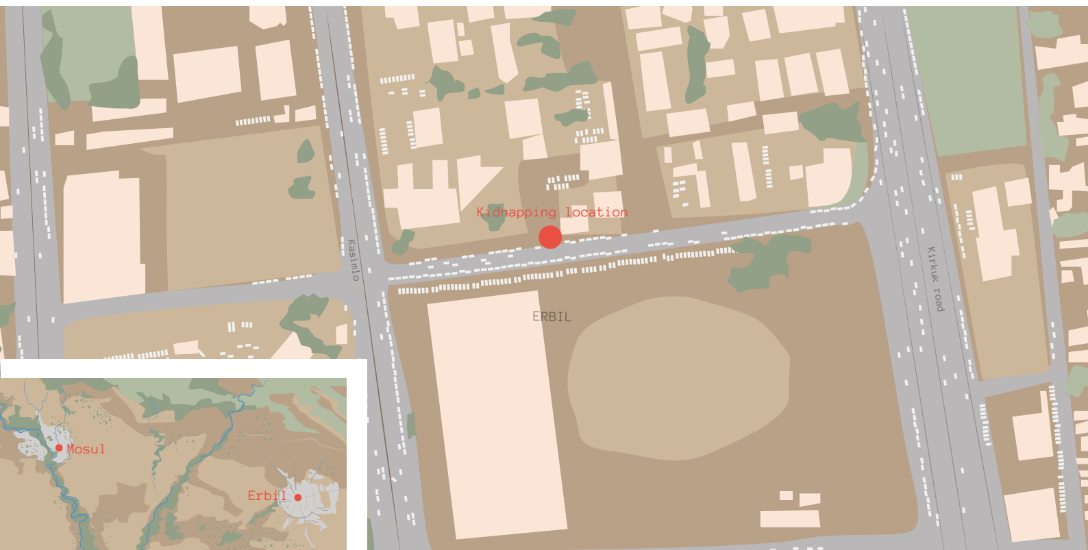
نەخشە هەولێر و موصل، شوێنی رفاندن

سەر لەبەیان سێشەممە (۴ ئایاری ۲۰۱۰)، پینچ مانگ پاش لە بلاوکردنەوهی ئەو نوسینە کە ئیمە پێمانوایە بوو تە هۆی کوشتنی، سەردەشت لەلایەن سەرداری برابەرەوه لە بنیای پەیمانگای هونەرە جوانەکانی زانکۆی سەلاحەدین دادەبەزێرت لە بەرامبەر دەرگای سەرهەیدا. 101 سەردار لە راپۆرتیکی نیویۆرک تایمزدا دەلێت: "سەردەشت لە ئۆتۆمبیلەکە [دابەزی لە بەردەم پەیمانگای هونەردا، کە لاینکەم نیو دەرزن سەرباز لە یەکە زێرقانی، کە مەشقیپێکراون و سەر بە هێزی چەکداری پیشمەرگە کوردن، بەردەوام پاسەوانی دەرگای دەکەن". 102 ئەو کاتە شەقامە کە قەرەباڵغ بوو، کە کاتی پرھات و چۆی بەیانیان بوو لە هەولێر. 103 ئەندامیکی یەکە پیشمەرگە کە لە شوێنی رووداو کە ئامادەبوو رایگەیاندا کە شوێنە کە زۆر لەو قەرەباڵغتر بوو کە بتوانی رفاندنە کە ببینێ. 104